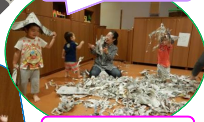
新聞紙で作った兜を被りご機嫌です★