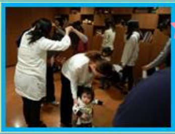
みんなでロンドンブリッジ!